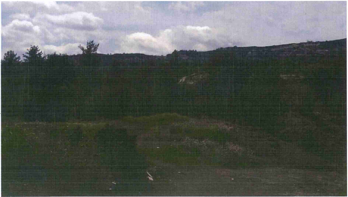
(Α) ΑΚΙΝΗΤΟ ΥΠΟ ΕΚΤΙΜΗΣΗ